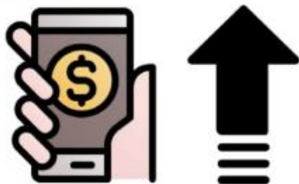
COMERCIO DIGITAL A LA ALZA